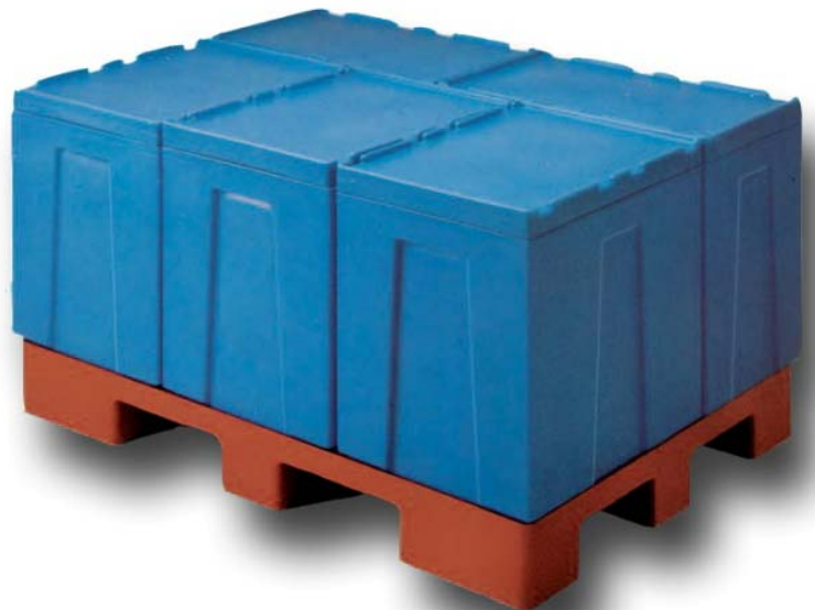
Fünf Stück Metabox 70 auf einer Palette 1200 x 1000 mm