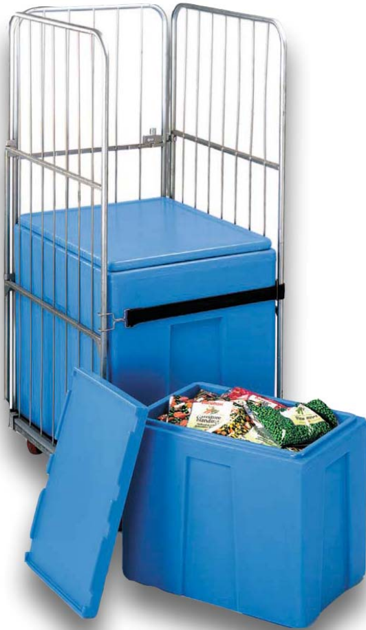
Metabox auf einem Rollcontainer